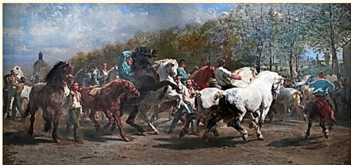
Le marché aux chevaux 1852-1855

Très appréciée dans les pays anglophones, son œuvre tomba dans l'oubli en France après sa mort. Le bicentenaire de sa naissance est l'occasion de sortir de l'ombre cette personnalité inspirante, d'une grande modernité, qui sut dépasser sa condition de femme et une enfance difficile pour réaliser son rêve.