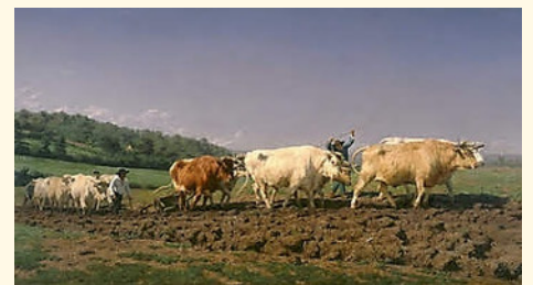
Labourage nivernais - 1849

Elle s'enfuit de l'école, puis de l'atelier où elle était apprentie, déclarant qu'elle voulait faire de la peinture, et elle vainquit l'opposition de son père à ce sujet. Ce fut dans le bois de Boulogne, qui possédait encore son aspect sauvage, qu'elle fit ses premières études. Lamennais, et plus tard George Sand eurent une influence décisive sur son esprit, et l'affranchirent des préjugés. Jeune fille, elle prit des vêtements d'homme pour fréquenter les abattoirs, les foires, se mêlant aux maquignons, aux toucheurs de bœufs.